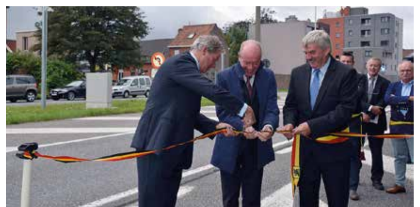
Inhuldiging vrachtwagensluis Zelzate op 18 augustus 2014.